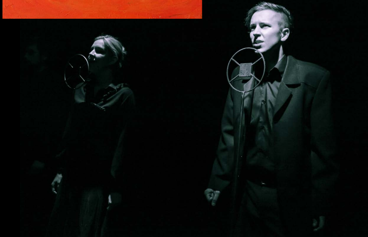
Teatr Fieter – „Którzy upadają” (2011)