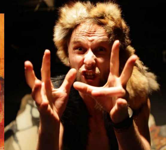
Kompania Teatralna Mamro „Grunwald 2000” (2014)