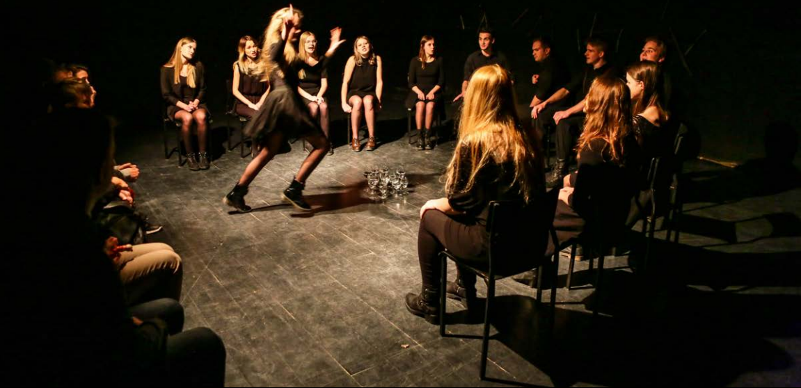
Teatr Ecce Homo – „Nieskończony Zbiór Wszystkich Innych” (2016)